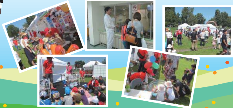
写真は昨年の様子です。